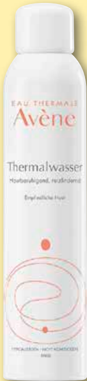
Avène Thermalwasser- Spray