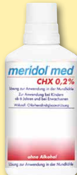
meridol ® med CHX 0,2% Lösung