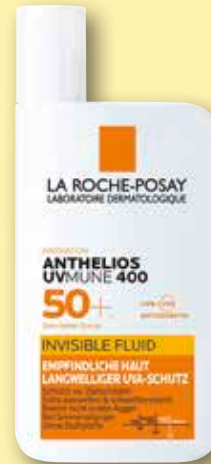
La Roche-Posay Anthelios Invisible Fluid UVMune 400