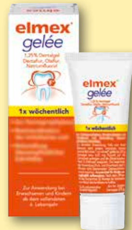
elmex ® gelée