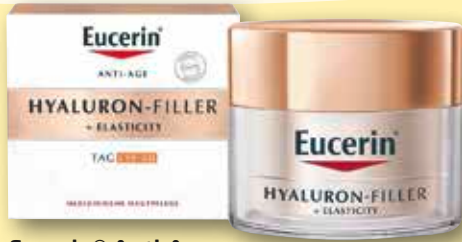
Eucerin ® Anti-Age Hyaluron-Filler + Elasticity Tag LSF 30 50 ml